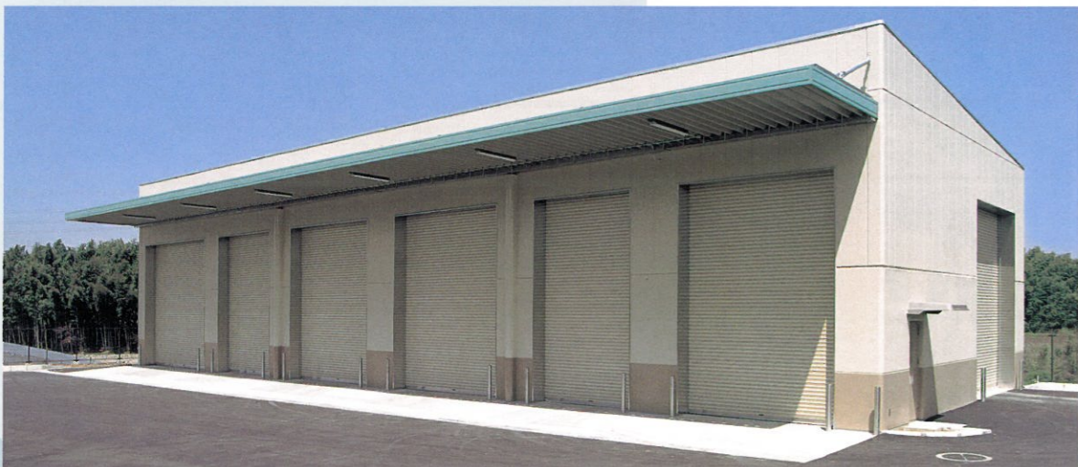
保管庫棟 Storage building