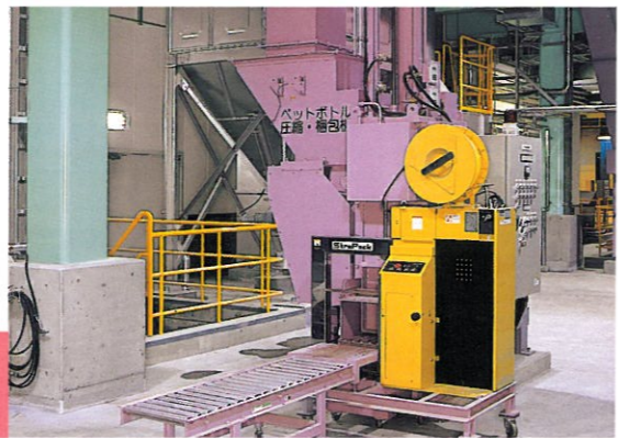
ペットボトル圧縮・梱包機 PET-bottle Press and packager