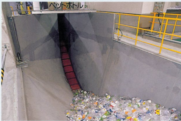
ペットボトル受入ホッパ PET-bottles receiving hopper

PET-bottles delivered to the receiving hopper are carried to the foreign objects removal conveyor by the carrying conveyor. After the removal of foreign/inappropriate matter, PET-bottles are pressed and packaged by the PET-bottle Press and packager.